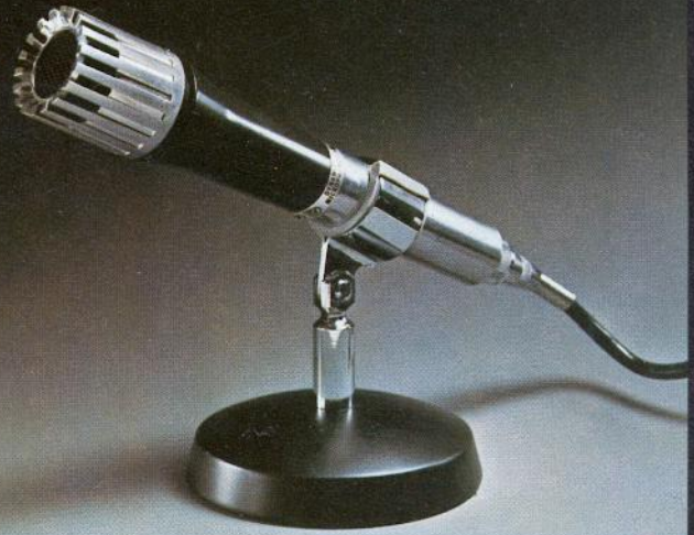
DM-51 L Dynamisches Mikrofon mit Kugelcharakteristik 50–15 000 Hz, Imp. 10 k \Omega , inkl. Mic.-Ständer.