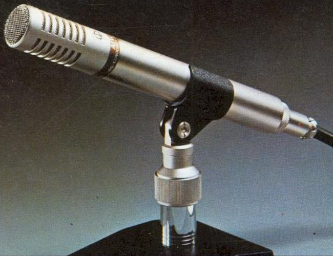
CM-1016* Elektret Kondenser Richtmikrofon Sprach- und Musikschalter, 50–15 000 Hz, Imp. 600 \Omega , Gewicht nur 145 g.