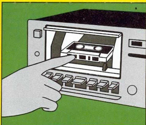
Durch ein Hydrauliksystem wird die Cassette lautlos und automatisch in Abspielposition gebracht und eingerastet.