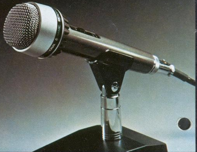
DM-503* Dynamisches Richtmikrofon mit Schalter 100–12 000 Hz, Imp. 600 \Omega /50 k \Omega .