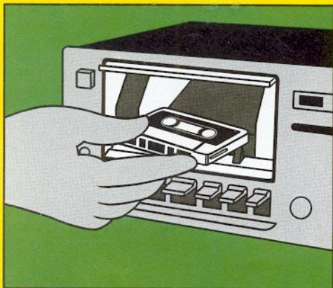
Kassette waagrecht einlegen.