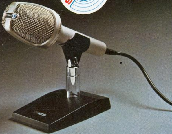
CM-2000* Elektret Kondenser STEREO Richtmikrofon 50–17 000 Hz, Imp. 250 \Omega , Gewicht 300 g, 1,5 V, Batterie-Lebensdauer bis 4000 Std.